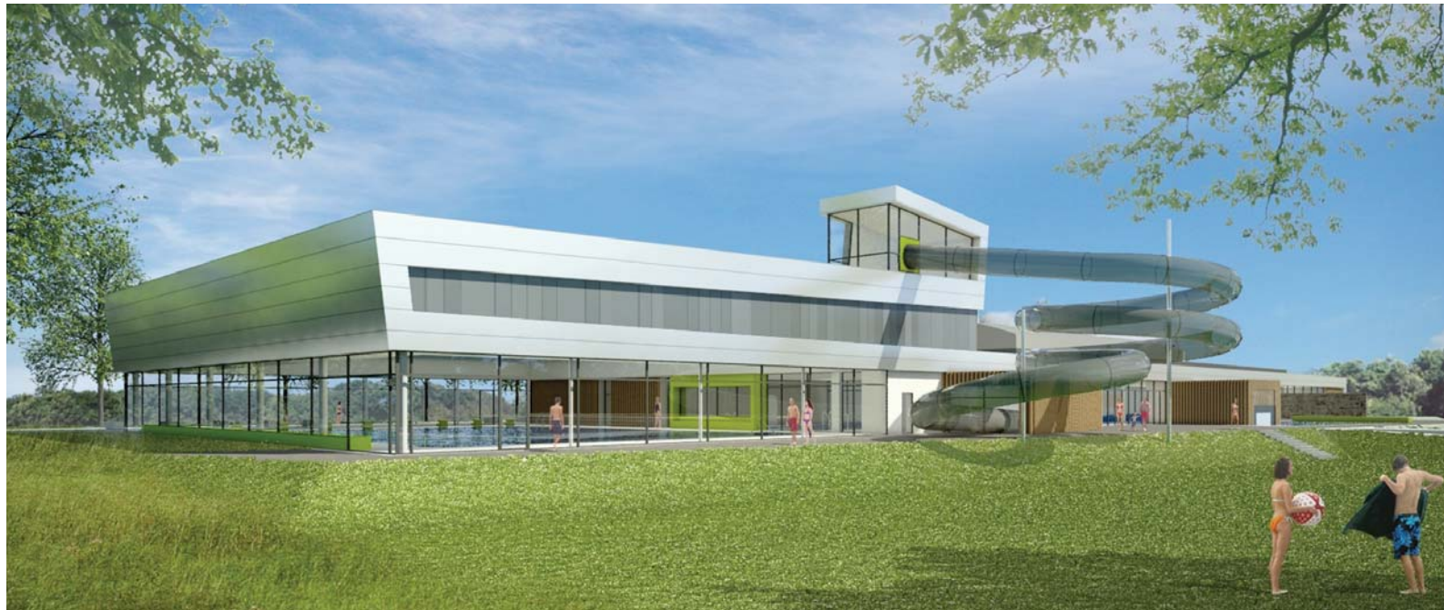
Im Vordergrund die Sportschwimmhalle mit der Riesenrutsche, daran schließt sich der Freizeitbereich an. Im hinteren Gebäudeteil der Saunabereich mit großem Saunagarten.

Im neuen Allwetterbad gibt es eine Sportschwimmhalle, einen Multifunktionsbereich mit Hubboden für diverse Aqua-Sportarten, einen Freizeit- und Erlebnisbeckenbereich mit Großrutsche - auch mit Reifen nutzbar - sowie ein