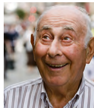
Seniorinnen und Senioren: Ausgabe 6 (April 2012)

In unseren nächsten Ausgaben finden Sie Interessantes und Wissenswertes für und über