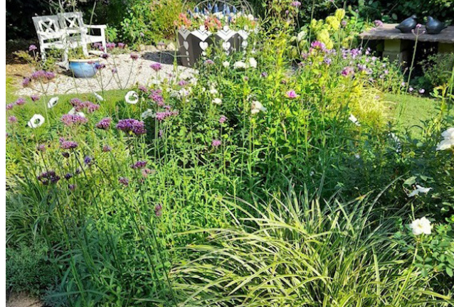
Ökologische Vielfalt ist auch pflegeleicht zu haben.