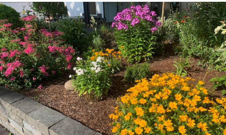
Die Gartengestaltung selbst in die Hand nehmen: Von der Rasenfläche bis zum naturnahen Garten ist vieles möglich.

Die Gartengestaltung ist den Eigentümerinnen und Eigentümern überlassen. Sie haben hier weitestgehend freie Hand, eigene Ideen und Vorstellungen für eine Grünfläche umzusetzen – eine Ausnahme sind die hier genannten Schottergärten, geregelt in der Niedersächsischen Bauordnung sowie Satzungen der Gemeinden vor Ort.