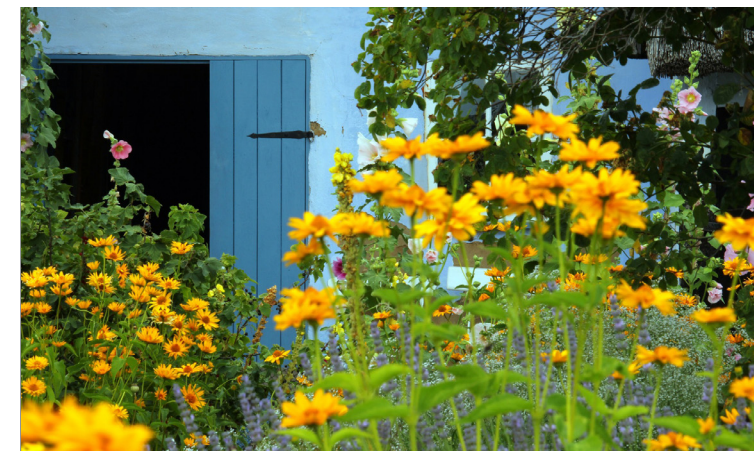
Grünflächen und Pflanzen sind gut für Wasserhaushalt, Stadtklima und Artenschutz.

Gut für Flora und Fauna: Gärten können ökologisch wertvoller Lebensraum für Insekten, Vögel, Säugetiere und Bodenlebewesen sein. Naturnahe Gärten etwa bieten für Schmetterlinge, Bienen, Hummeln und auch Vögel Nahrung und Nistmöglichkeiten sowie Verstecke. Das ist gut für die Artenvielfalt und ist auch für Gartenbesitzerinnen und -besitzer ein schöner Anblick.