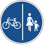
Getrennter Fuß- und Radweg