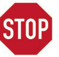
Anhalten! Dann Vorfahrt gewähren

Diese Schilder musst Du in jedem Fall beachten.