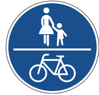
Gemeinsamer Fuß- und Radweg